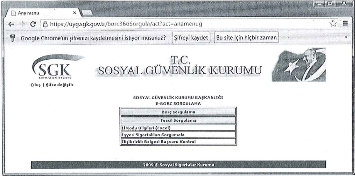
Şekil 5- İdarelerce e-borç Sorgulama Ekranı Ana Sayfası