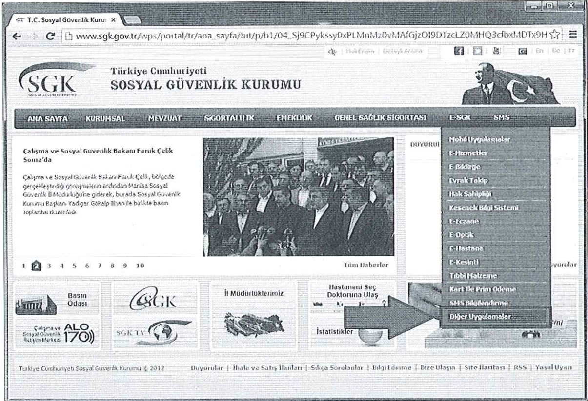
Şekil 1- www.sgk.gov.tr İnternet Sitesi